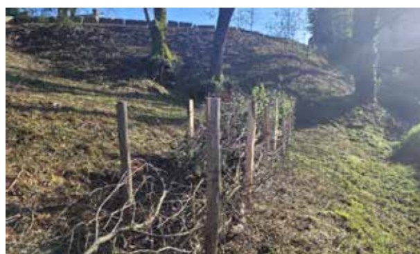
Réalisation d'une haie de Benjes