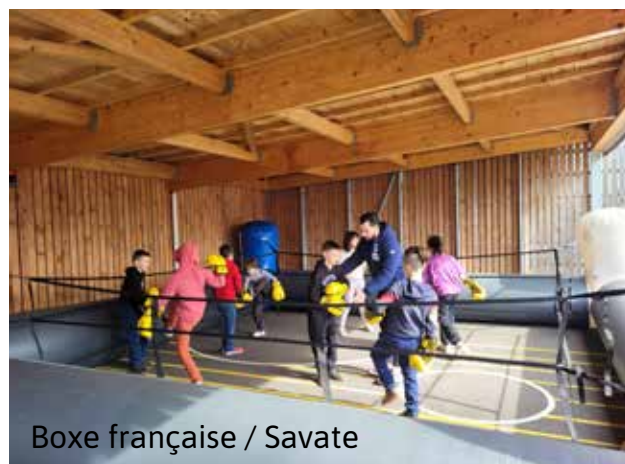
Boxe française / Savate