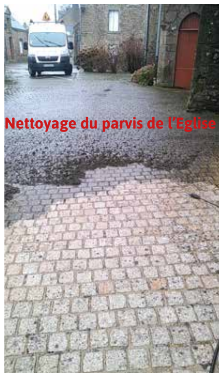
Nettoyage du parvis de l'Eglise