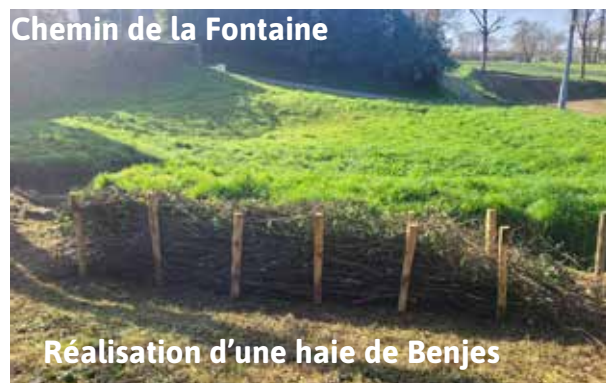
Chemin de la Fontaine